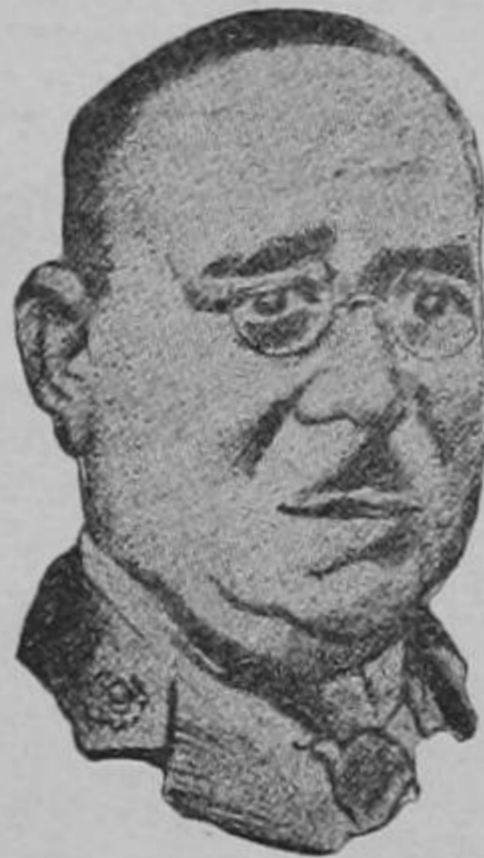
CORONEL ARANDA, jefe glorioso de la defensa de Oviedo, rescatado ayer por las armas triunfantes del generalísimo Franco.

No me parece justo, ni patriótico, que nosotros los españoles Pasa a la pág. 8