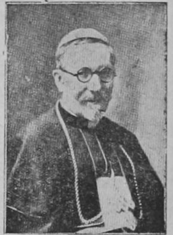
MONSEÑOR CELSO CONSTANTINI Secretario de la Congregación de la Propagación de la Fe.—Antes Delegado Apostólico en China